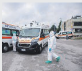
COVID II «San Carlo»

tro il coronavirus per tutti quei soggetti a rischio e per i pazienti di età superiore a sessantacinque anni. La campagna per la vaccinazione antinfluenzale è partita lo scorso 6 novembre