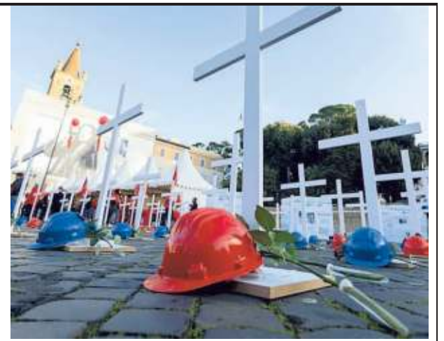
Il tema della sicurezza

Nel nostro Paese continuano le morti sul lavoro. In piazza del Popolo i sindacati chiedono una svolta. E i lavoratori rilanciano la protesta: i birilli simboleggiano i caduti, caschi rossi e blu sono posati sotto le croci