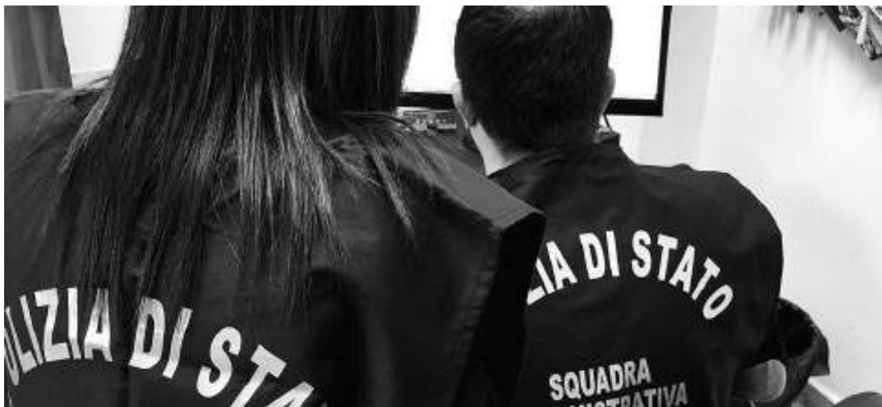
● Agenti della Divisione di Polizia Amministrativa

TARANTO - Controlli della Polizia di Stato: sanzionato un ristorante, eseguiti anche un arresto ed una espulsione dal territorio nazionale.