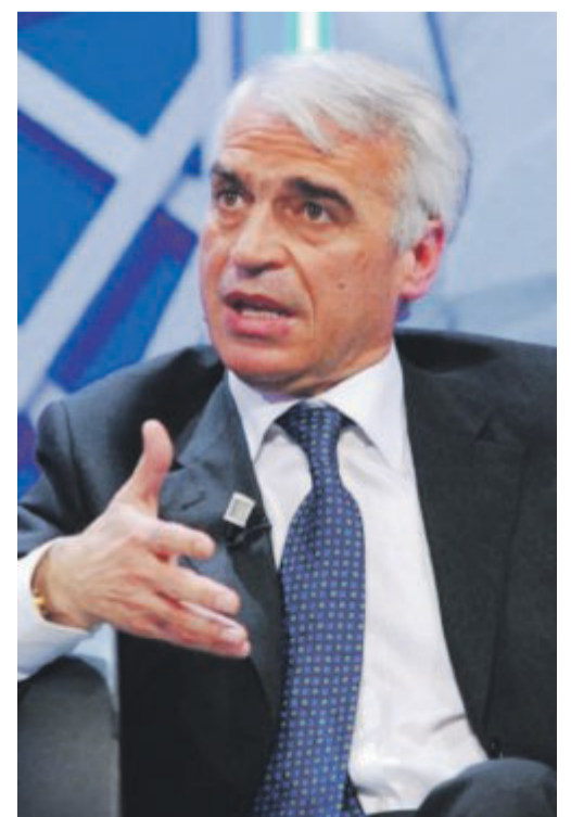
PRUDENTE L'assessore regionale Rocco Palese