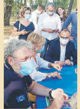
La firma dell'accordo

● GROTTAGLIE. È stato sottoscritto nel "Parco del sorriso", il protocollo d'intesa tra l'Asl Taranto, la Regione, il Comune di Grottaglie e l'associazione Arca, «per i percorsi di autonomia e inclusione sociale delle persone con fragilità». Si evidenzia l'importanza degli spazi aperti e dei parchi della salute quali strumenti incisivi nelle azioni di cura, utili per sviluppare una migliore consapevolezza ed espressività del sé, raggiungendo l'autorealizzazione e la partecipazione attiva alla vita comunitaria. Emerge l'importanza di «interventi assistiti con animali, la green therapy, laboratori diurni, weekend formativi, campi estivi, progetti con scuole, enti e associazioni, per promuovere valori come la solidarietà e la coesione sociale». «Questa è una bellissima struttura dell'Asl Taranto, già sede di servizi veterinari e di abitazione - dichiara Stefano Rossi, direttore generale Asl Taranto -. Il parco si presta perfettamente ad attività di inclusione attraverso la pet-therapy». «Promuovere il benessere delle persone fragili - ha dichiarato il presidente Emiliano -, sostenere la coesione sociale, incoraggiare nuovi stili di vita. C'è la consa-