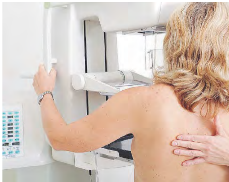
INCUBO PER LE DONNE Una paziente si sottopone a mammografia: il cancro mammario nel mondo colpisce 1,6 milioni di persone

«Tali farmaci, con meccanismi d'azione innovativi, consentono di ottenere una buona qualità di vita e di riappropriarsi del proprio futuro, conducendo una vita normale in remissione dalla malattia. I risultati, a 48 mesi di controlli - dice Sergio Amadori, Presidente Nazionale AIL (Ass. It. contro leucemie, linfomi e mieloma) - confermano i benefici del trattamento nel ridurre il rischio di progressione della malattia anche 2 anni dopo lo stop della terapia. Inoltre, il regime a durata fissa di 24 mesi e senza chemioterapia, dimostra che il 64% dei pazienti raggiunge la negatività della MRD (la malattia, cioè, risulta così residuale da non essere rilevabile con gli strumenti diagno-