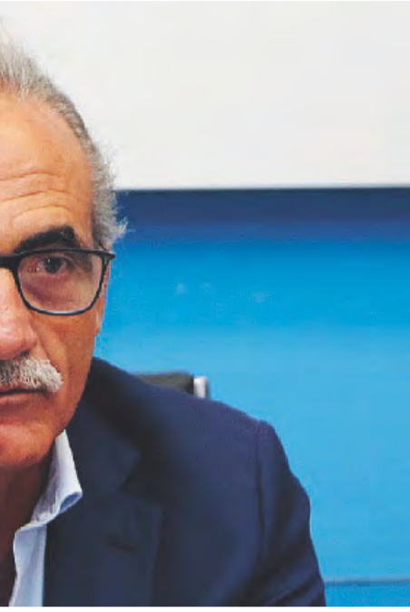
IN PRIMA LINEA Michele Conversano direttore del Dipartimento prevenzione della Asl di Taranto