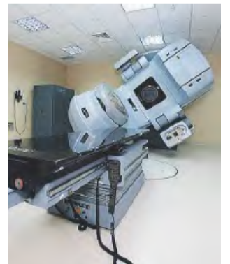
Macchina per Radioterapia