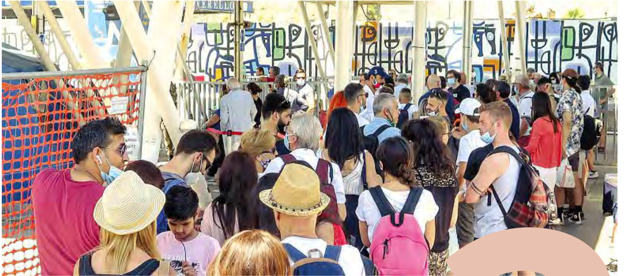
A Napoli il Molo Beverello preso d'assalto dai turisti diretti a Capri, Ischia e Procida in traghetto o in aliscafo

Sono eventi previsti, perché il virus continua a circolare Ora tutto si gioca sulla tempestività dell'intervento per isolarli